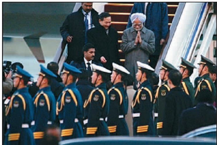
1月13日,印度总理辛格乘坐的专机抵达北京首都机场,图为辛格走下飞机舷梯。

分析认为,在这种发展态势下,辛格访华推动中印更深层次的经贸合作可谓务实之举。印度未来的发展政策对于中国公司来讲,蕴含着巨大商机;而中国的日益发展正在培养日渐成熟的消费